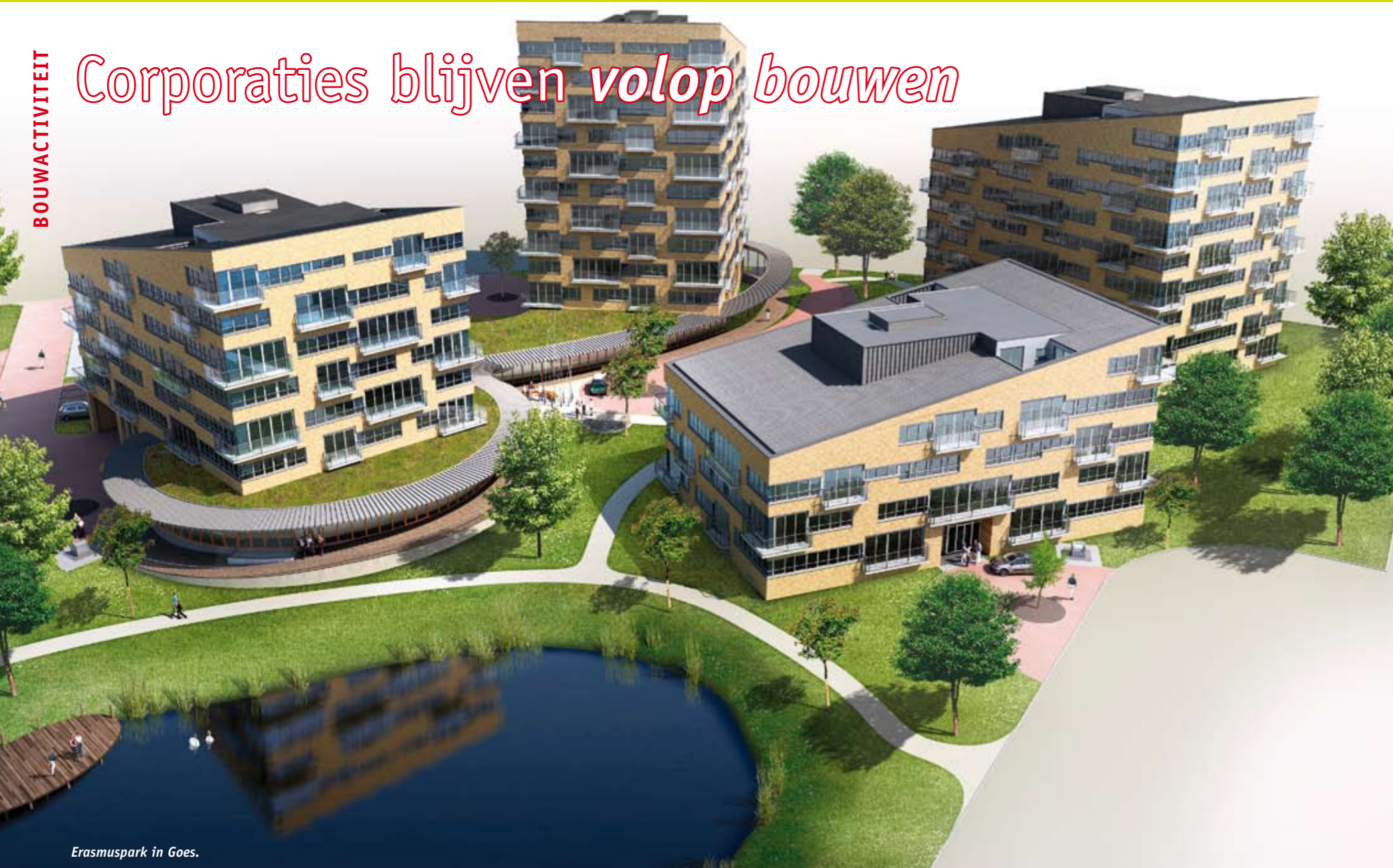
Erasmuspark in Goes.

Veel projectontwikkelaars en andere bouwers houden pas op de plaats. Doorgaans moet er eerst zoveel procent van de woningen verkocht zijn, pas dan gaan de bouwvakkers aan de slag. Het aantal verkopen loopt echter terug. Met als gevolg dat het op veel bouwplaatsen stil is. Toch wordt er nog gebouwd, ook in Zeeland. Vooral door corporaties.